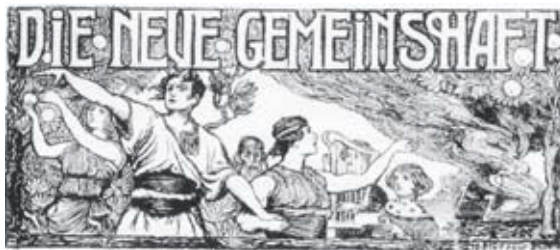
Intentionale Gemeinschaften? Schon hundert Jahre alt ...

Der Ruf „Lebensraum im Osten“ z. B. war in der Weimarer Republik verbunden mit der Idee, weitgehend ungenutzte landwirtschaftliche Flächen aus Großgrundbesitz im Osten des Reichs Gemeinschafts- und Selbstversorger-Projekten zur Verfügung zu stellen. Auch der tiefe und echte Wunsch nach