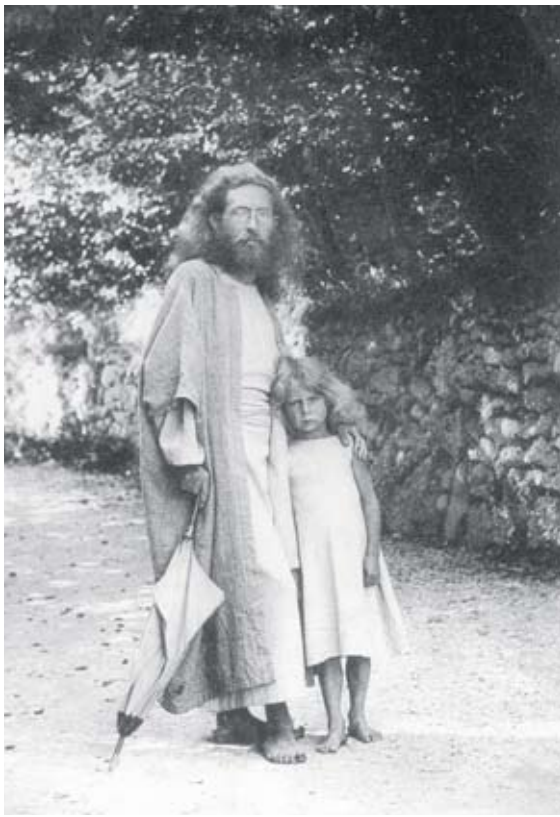
Nicht 1966, sondern vorletzte Jahrhundertwende: Der Künstler und Naturapostel Karl Wilhelm Diefenbach mit seiner Tochter im Zentrum der Lebensreformer, dem Monte Verità. Rechts: Eine Zeitschrift der heterogenen Lebensreformbewegung.