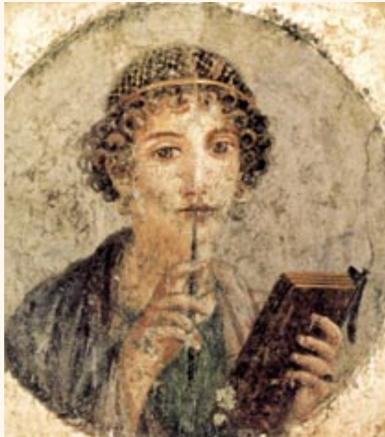
Die griechische Dichterin Sappho gründete im 6. Jahrhundert v. Chr. auf der Insel Lesbos eine Bildungsgemeinschaft für Mädchen.