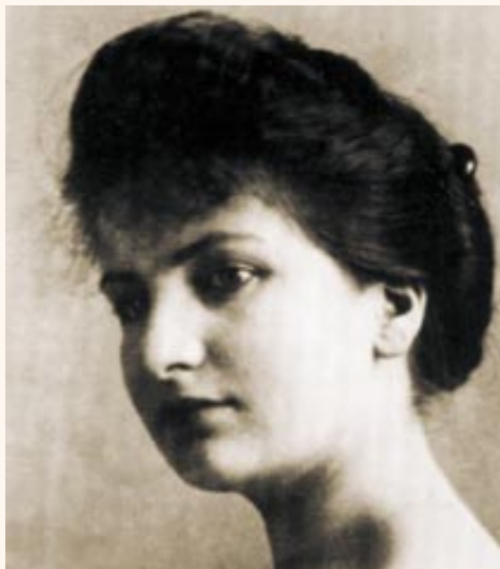
Alma Mahler-Werfel, 1879–1964, Komponistin, brach ihre künstlerische Laufbahn zugunsten ihrer Ehe mit Gustav Mahler ab.

Auf der sozialen Ebene beruhen matriarchale Gesellschaften auf dem Clan. Matriarchale Menschen leben in großen Sippen zusammen, die nach dem Prinzip der Matrilinearität, der Verwandtschaft in der Mutterlinie, aufgebaut sind. Der Clannamen, die sozialen Würden und politischen Titel werden in der mütterlichen Linie vererbt. Ein solcher Matri-Clan besteht aus mindestens drei Generationen von Frauen: die Clannmutter und ihre Schwestern, deren Töchter und Enkelinnen und den direkt verwandten Männern: die Brüder der Clannmutter, die Söhne und Enkel. Ein Matri-Clan lebt im großen Clanhaus zusammen, das 10 bis 100 Personen je nach Größe und architektonischem Stil umfassen kann. Die Frauen leben permanent hier, denn Töchter und Enkelinnen verlassen das mütterliche Clanhaus in der Regel nicht. Ihre Gatten oder Geliebten kommen in „Besuchsehe“ aus deren Mutterhäusern nur über Nacht zu ihnen,