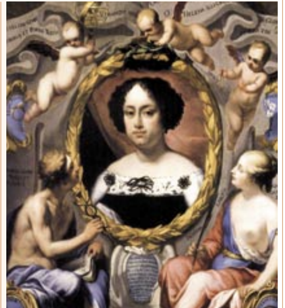
Elena Lucrezia Cornaro Piscopia, geboren 1646 in Venedig, Philosophin und erste unterrichtende Doktorin an einer Universität.

Wenn hier der Begriff „Matriarchatsforschung“ gebraucht wird, ist dabei vorausgesetzt, dass die patriarchale Gesellschaftsform nicht als die Umkehrung der patriarchalen missverstanden, sondern mit ihren eigenen Spielregeln erkannt wird. Diese Erkenntnis hat sich in den deutschsprachigen Ländern durchzusetzen begonnen, im anglo-amerikanischen Sprachraum hingegen weniger, was nicht zuletzt auf die falsche Übersetzung des Bachofenschen Begriffs „Gynaiokratie“, d. h. Frauenherrschaft, mit dem Begriff „Matriarchy“, d. h. Matriarchat zurückgeht. Dabei handelt es sich jedoch um zweierlei, das häufig unreflektiert vermischt wird: