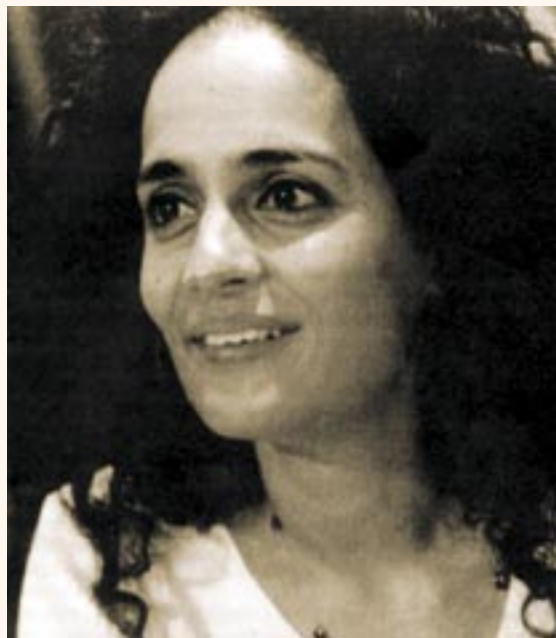
Arundhati Roy, geboren 1960 in Indien, Autorin und politische Aktivistin, protestiert gegen den heutigen Globalisierungswahn.

Auf der ökonomischen Ebene ist keine weitere Steigerung der Großindustrien und des so genannten Lebensstandards mehr möglich – wir laufen Gefahr, die Biosphäre der Erde vollends zu zerstören. Hier eröffnet sich als Alternative die Subsistenz als Wirtschaftsform der kleinen und regionalen Einheiten. Weltweit geht es darum, die Strukturen von Subsistenzwirtschaft, die